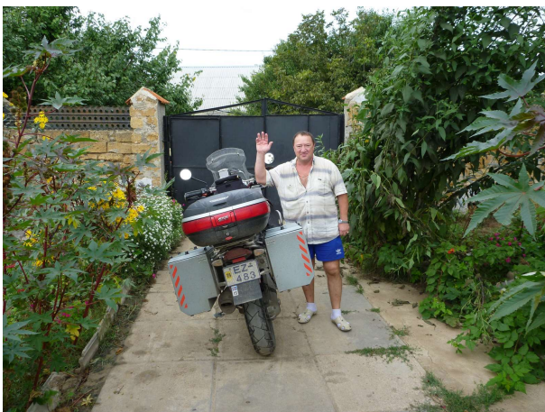
Húsráðandi mættur til að opna hliðið

Umhverfis húsið var 2,5 m há girðing og húsráðandi hafði læst hliðinu, ég varð því að bíða þar til hann kom um morguninn til að hleypa mér út.