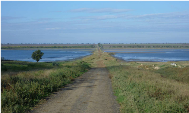
Votlendið og brúin í fjarsta

Ferðin gekk vel í fyrstu, sæmilegur vegur en síðan fór að verða lítið um mannaferðir, malbikið hvarf og við blasti leir-troðningur gegnum votlendi og brú í miðjunni. Þetta hefði nú ekki verið neitt mál ef ekki hefði ringt nýlega og leirinn þar af leiðandi blautur og háll.