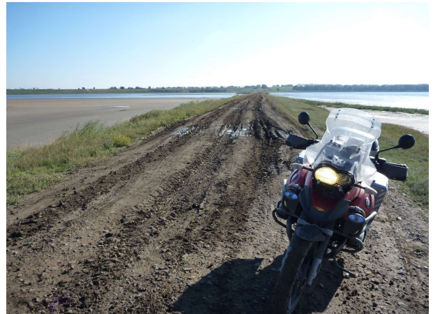
Kominn yfir mestu drulluna og brúin í baksýn

Ég ákvað að ganga að brúnni og skoða hvort hægt væri að komast yfir hana og reyndist svo vera, restin virtist svo vera í lagi. Gekk þetta ágætlega upp á brúnnu og var hægt að keyra í fyrsta gír án þess að snuða kúplinguna að ráði, en eftir brúnnu versnaði í því, varð þá mjög hált og endaði á því að framdekkið rann til hliðar og hjólið seig á vinstri hliðina. Eftir að búið var að reisa það við og skoða aðstæður var haldið áfram. Þurfti að láta kúplinguna snuða þar sem púlsarnir frá mótornum í hægagangi voru nægir til að afturdekkið missti grip og fór að renna til. Þegar uppá malbikið var komið var þykkt leirlag á dekkjunum og malbikið mjótt vegna gróðurs í köntunum. Eftir dálítinn spotta birtist hrörlegt og stórt fjós, síðan fleiri hús og fólk, síðan mætti ég ísbílum og þá vissi ég að þetta yrði í lag.