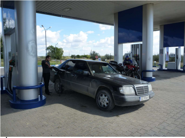
Úkraínsk bensínstöðin við landamæri Moldavíu