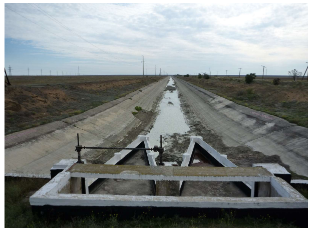
Einn af mörgum áveituskurðum