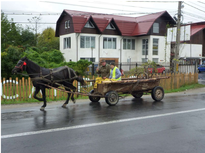
Hestvagnar eru algengir í Rúmeníu

Hitinn náði varla að fara yfir 10°C í dag og eftir ca 40 km byrjaði að rigna eins og yr.no hafði spáð. Stefnan hafði verið tekin á Bran kastala sem var í 60-70 km fjarlægð og í bænum við kastalann var fundið hótél. Síðan var labbað um með regnhlíf og kastalinn skoðaður.