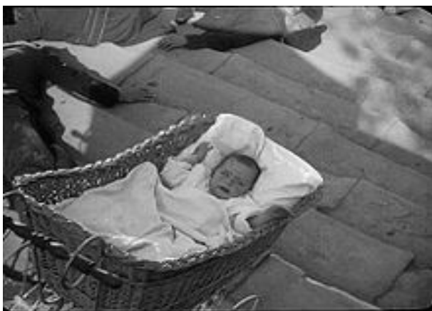
Fræga atriðið úr myndinni Battleship Potemkin

Stíginn er frægur úr myndinni Battleship Potemkin frá 1925 þar sem barnavagn fer stjórnlaust niður stígann.