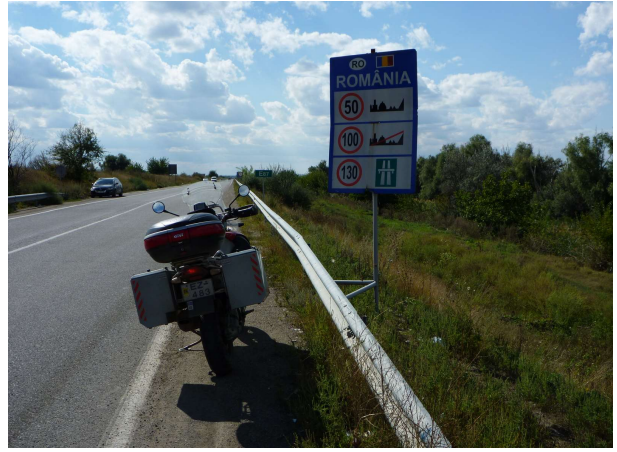
Kominn inni Rúmaníu