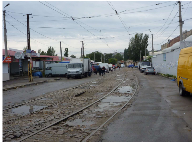
Hálar og hættulegar götur