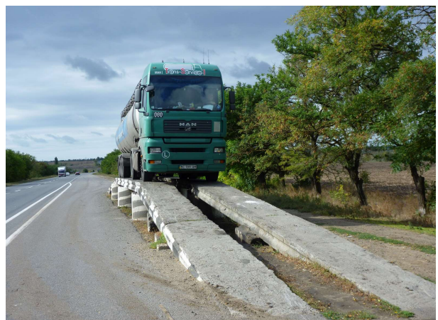
Svona útbúnaður er algengur í löndum USSR