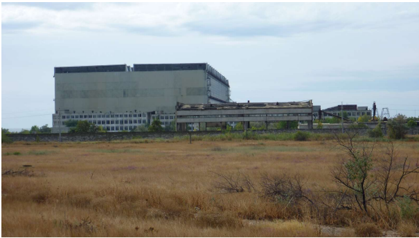
Hluti af skipasmíðastöðinni

Í bænum var risastór skipasmíðastöð sem virtist ekki vera í notkun.