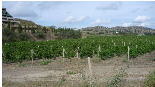
Vínakrar voru víða á Krímskaganum

Síðan var haldið áfram og ekið suður og vestur með strönd Krímskagans í góðu veðri, gegnum vínekrur og stundum niður við sjó en stundum yfir fjöll. Margir bílar með rússnesk númer voru á ferðinni og einnig nokkur mótórhjól sem annars sjást nánast ekki í Úkraínu.