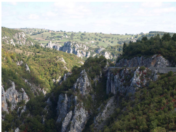
Svartfjallaland er fjöllótt

Farið af stað uppúr kl 8. Þá voru kallarnir á staðnum mættir í spjall og kaffi á matsölastaðinn. En ég hélt af stað til Svartfjallalands. Þegar þangað kom sóttist ferðin seint, vegurinn mjög hlykkjóttur og svo mjór á köflum að varla var hægt að mætast. Fór þó einu sinni í gegnum stóra borg sem var mjög snyrtileg, göturnar góðar, gangstéttir og fín hús. Endaði síðan í Kotor, á sama stað og í fyrra, eftir að hafa farið beint niður í bæinn ofan af fjallinu með 25 hárnálabeygjum.