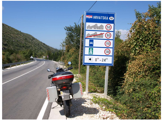
Á landamærum Króatíu

keyrði í gegnum Dubrónik þar sem var fullt af ferðamönnum á vespum. Þar kviknað viðvörðun á hjólinu um að það vantaði smurolíu, svo þegar stoppað var nokkuð norðar var 0,5 l bætt við og verkfærin þurrkuð í leiðinni eftir rigninguna í Úkraínu, sem tók ekki langan tíma í blíðunni. Síðan var haldið áfram norður með ströndinni inní Bosníu þaðan aftur inní Króatíu og endaði fyrir norðan Split.