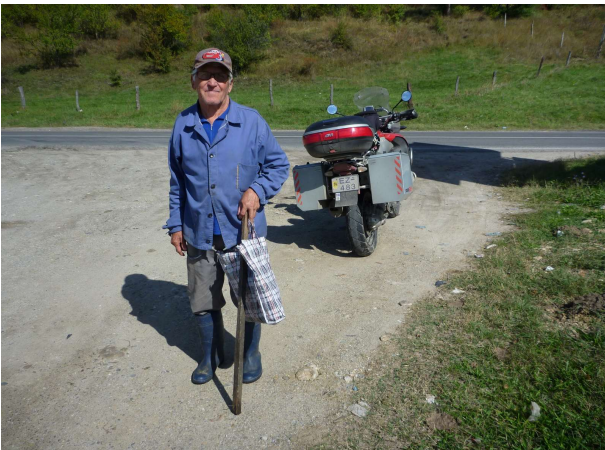
Geitasmalinn talaði smá þýsku

Þegar kom niður á sléttuna hitnaði og sólin skein á akrana. Á vegi mínum urðu gamall geitasmali og rafvirki til 30 ára sem hafði svo mikinn áhuga á að tala við mig að það var nærri búið að aka yfir geiturnar hans, flugvélar við vegasjoppu og 2 franskir rally kappar á Renault 6x6 truck. Gist var í borginni Drobeta-Turnu Sverin sem er með óvenju snyrtilega göngugötu. Komst síðar að því að borgin er að mestu byggð Sígaunum.