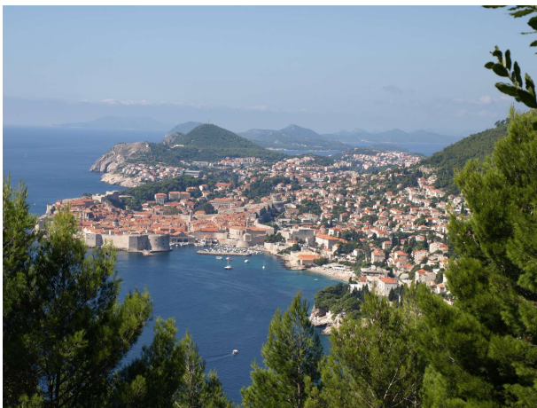
Dubrónik í Króatíu

keyrði í gegnum Dubrónik þar sem var fullt af ferðamönnum á vespum. Þar kviknað viðvörðun á hjólinu um að það vantaði smurolíu, svo þegar stoppað var nokkuð norðar var 0,5 l bætt við og verkfærin þurrkuð í leiðinni eftir rigninguna í Úkraínu, sem tók ekki langan tíma í blíðunni. Síðan var haldið áfram norður með ströndinni inní Bosníu þaðan aftur inní Króatíu og endaði fyrir norðan Split.