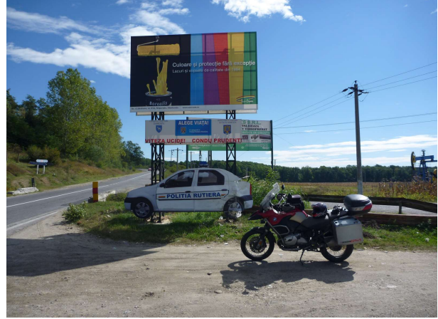
Beygluð eftirlíking af lögreglubíl

Þegar kom niður á sléttuna hitnaði og sólin skein á akrana. Á vegi mínum urðu gamall geitasmali og rafvirki til 30 ára sem hafði svo mikinn áhuga á að tala við mig að það var nærri búið að aka yfir geiturnar hans, flugvélar við vegasjoppu og 2 franskir rally kappar á Renault 6x6 truck. Gist var í borginni Drobeta-Turnu Sverin sem er með óvenju snyrtilega göngugötu. Komst síðar að því að borgin er að mestu byggð Sígaunum.