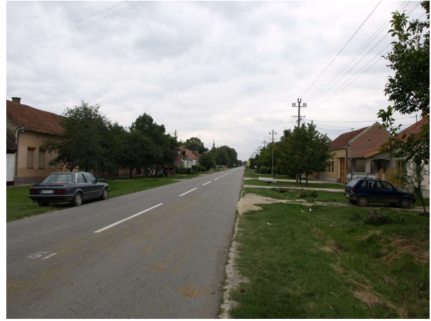
Þorpsgata í Serbíu

Síðan farið yfir til Serbíu, það var engin umferð um landamærin. Eftir að Garminn ætlaði að láta mig fara með ferju sem var búið að leggja niður fyrir löngu þá flippa hann út og þurfti að slökkva á honum með „sænska-takkanum“ (taka rafhlöðuna úr). Við það tók hann sönsu og var farið yfir á brú í staðinn. Síðan var keyrt í heila eilífð gegnum endalaus þorp. Það var greinilegt að fólk var fátækt og bílarnir gamlir og lélegir. Eftir það lagaðist landslagið og að síðustu voru eknir tugir km eftir hlykkjótum dal. Endaði á aðal staðnum í bænum, niðurníddum matsölu-og gistað. Hér var veisla í fullum gangi, tugir kalla sátu að snæðingi, síðan var spiluð nokkurs konar tyrknesk músík og einn söng viðstöðulaust í marga tíma. Hroðalegur hávaði og óhljóð. Uppúr kl 22 féll þó allt í ljúfa löð.