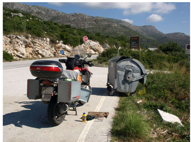
Verkfærin þurrkuð og bætt á olíu