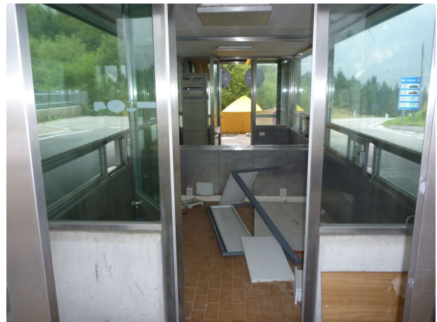
Landamæri Slóveníu og Ítalíu eftir Shengen