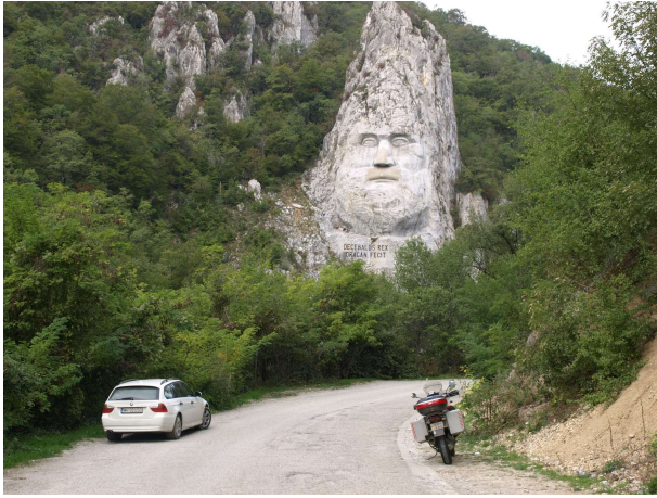
Hausinn við Dunareavatn