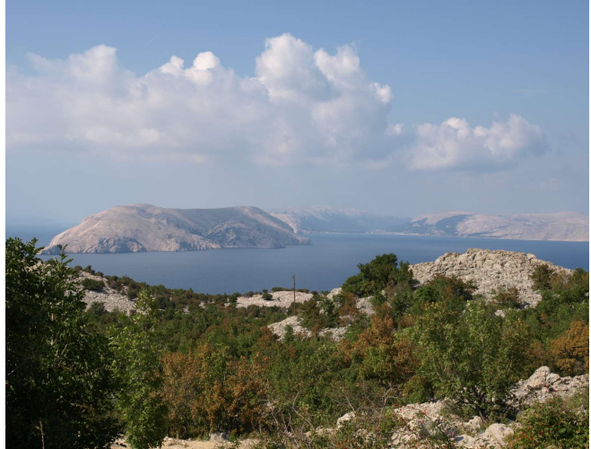
Gróðurlausar eyjar undan strönd Króatíu

Þar hlykkjaðist vegurinn eftir þröngum dölum og umhverfið var eins og í Austurríki nema ekki var hægt að skilja það sem stóð á skiltunum. Eftir nokkra leit fannst gisting á viðráðanlegu verði, en fyrsta hótelið sem var athugað kostaði 130 €. Nú fylgdu kartöflur með kjötinu en ekki þurfti að panta þær sér ein og í Austur Evrópu og morgunmaturinn var brauð og álegg. Ótrúlegt að þetta skuli hafa verið sama land og Serbía fyrir rúmum 20 árum, munurinn er ótrúlegur.