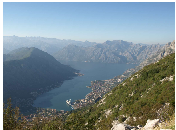
Borgin Kotor í Svartfjallalandi